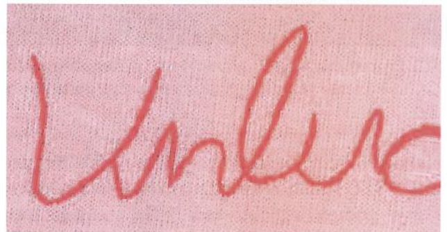
Sl.2 Reljefno naglašena optika vezanja, tradicionalnog izgleda veza, BURMILANA