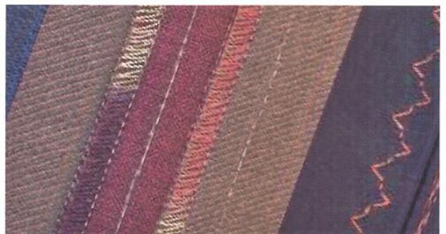
Sl.3 Ukrasni šavovi s MADEIRA koncima