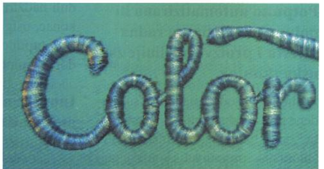
Sl.4 3D vezenje s Bodybuilderom i višebojnim koncem - vez s ispunjenim i reljefnim uzorkom