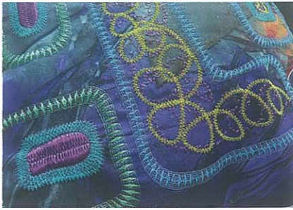
Abb. 2: Design von Bonnie Nielsen /Madeira zu anderen Spulenaufmachungen ist die MSC konenförmig, was das Herunterfallen des Garnes verhindert. Bei jedem Farbwechsel ermöglicht die Snap-Vorrichtung das einfache Einklemmen des Garnendes am Spulenfuss, sodass die Sticker ihre verschiedenen Farben ohne Garnverlust lagern können. Maschinen mit mehr und mehr Nadelstellen pro Kopf bieten nicht immer genug Raum für die gewünschte Anzahl von Spulen – hier spielt der extrem kleine Durchmesser der MSC eine sehr vorteilhafte Rolle.

Die neue MSC-Aufmachung wird nach und nach in den folgenden Qualitäten geliefert: