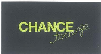
Abb. 1: feine Details mit Frosted Matt: Originalschriftgrösse nur 2,5 cm!

Schrumpf, Farbveränderungen, unschöne und verzogene Stickereien müssen nicht sein. Madeiras Zusatzservice setzt hier an. Im direkten Dialog mit den Kunden werden die Ursachen erforscht und gemeinsam mit Entscheidern und Produzenten verbessert. Schon nach einer Saison zeigt dieser Aufwand Wirkung. Die Marke tritt hochwertiger auf, die Stickereiqualität verbessert sich und die Kommunikation zwischen